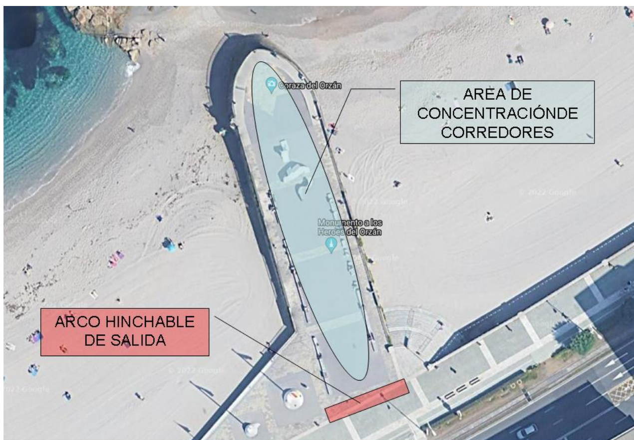
DETALLE DEL ÁREA DE SALIDA